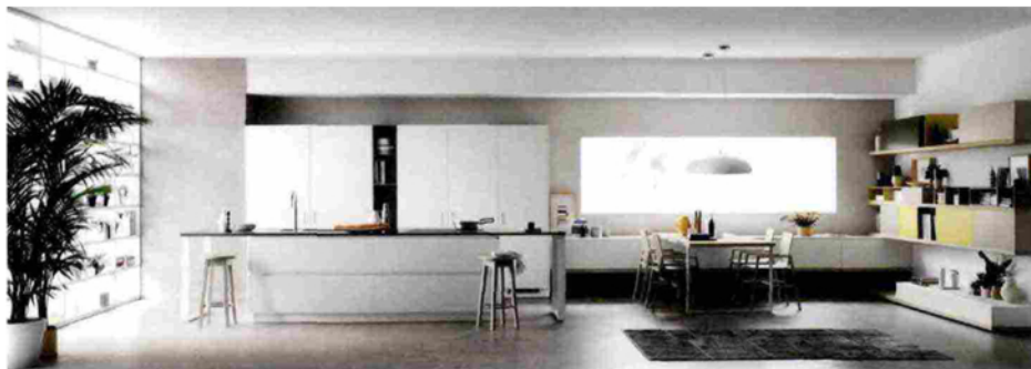
Foodshelf è la cucina Scavolini firmata da Ora-ito che è stata lanciata sul mercato nel secondo semestre 2015

Alle ultime aperture vanno aggiunti i quattro nuovi Store monomarca aperti ad Alessandria, Lucca, Modena e Lissone nei giorni scorsi, all'interno dei quali sono presenti le ultime